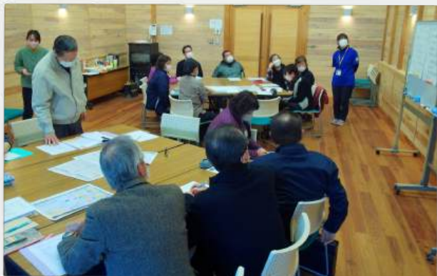
宮之浦・協議体で活動報告

令和6年度は、県の「シニア人材育成促進事業（熊毛地域）」と並行して協議体を実施し、町内から宮之浦区・松峯区に参加していただきました。地域の自慢できるところや強み、地域活動の課題等について話し合いを重ね、実践とその振り返りまで行うことで新たな課題や問題点も見えてきました。協議体を通じた各地区の取り組みについて、ご紹介いたします。