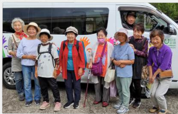
松峯・お試しお買い物ツアー

地域の困りごとから始まり、「何か地域でできることはないか」という思いが社会福祉協議会の「外出・移動支援車両貸出事業」へとつながっていきました。貸出対象者は、地域福祉のために車両を必要とする自治会や高齢者サロン団体等です。貸出に関する詳細は、社会福祉協議会へお問い合わせください。