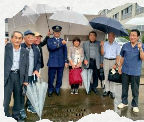
令和6年10月「鹿児島拘置支所」見学

今後も、安心して生活できる町づくりのため保護司会会員一同活動していきますので、変わらぬご支援・ご鞭撻のほどよろしくお願いいたします。ありがとうございました。